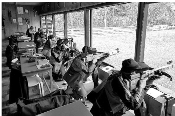
Eröffnungsschiessen der Tellenbrüder an der Römerstrasse

Neu dieses Jahr ist die Reglements-Änderung, dass kniend oder sitzend aufgelegt geschossen werden darf. Somit wird die diesjährige Vereinsmeisterschaft komplett anders als gewohnt aussehen.