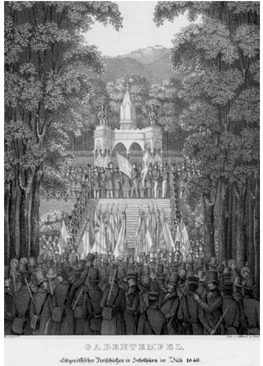
Gabentempel am Eidg. Freischiessen 1840 in Solothurn

Ziel des Sportschiessens ist es, die Mitte einer Scheibe zu treffen. Dies durch Einklang von Körper (statischem Aufbau und Körperbeherrschung) und Geist (innere Ruhe und