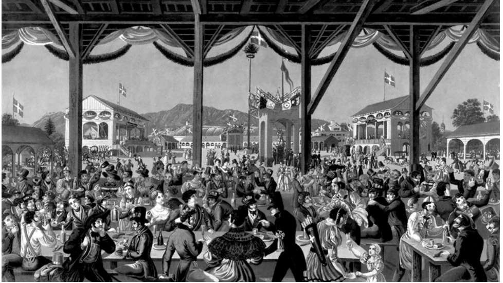
Eidg. Schützenfest 1834 in Zürich

Kontrolle von äusseren Einflüssen). Dies erfordert viel Training, sowohl körperliches als auch mentales. Gern werden diese Belastungen unterschätzt. Also: immer dranbleiben!